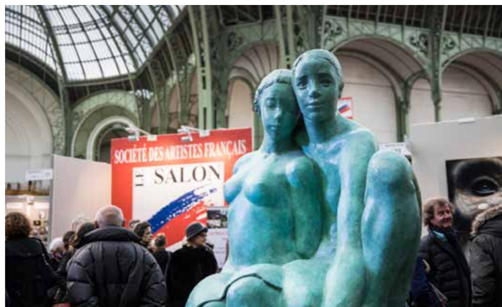
Salon des Artistes Français au Grand Palais Février 2017

Nous avons une vision sur le long terme... Nous fêtons notre 228 e édition!