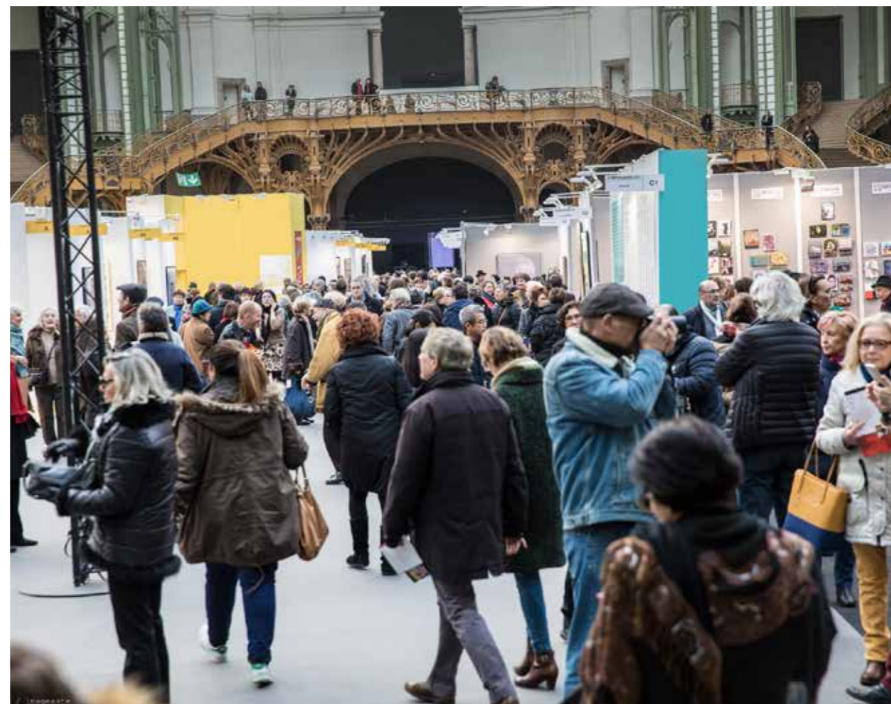
Salon des Artistes Français au Grand Palais, Février 2017

Nous offrons une autre vitrine de l'art, une chance pour de nombreux artistes de se faire connaître hors des circuits dits « traditionnels » (Galleries, art fair) et de pouvoir exposer au Grand Palais. Eclectique, accessible à tous les