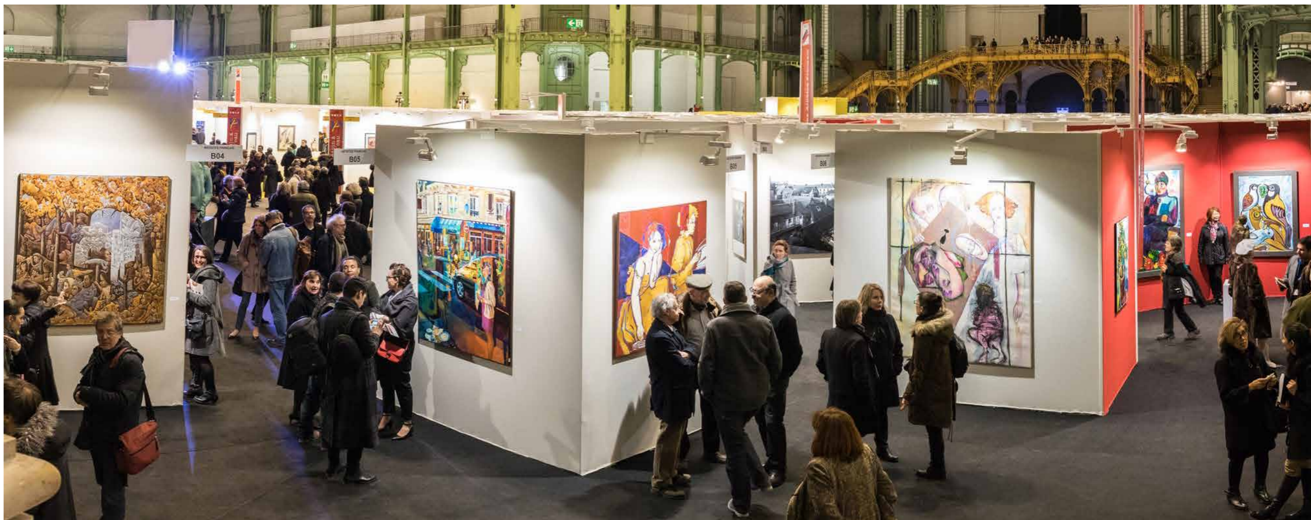
Salon des Artistes Français au Grand Palais Février 2017